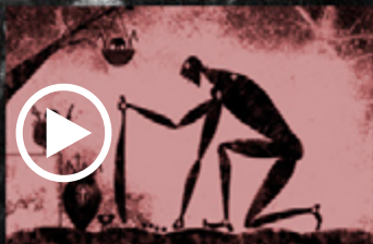
Videos oficiales INSIDE

“...Yet few careers have impressed me more – or represented such boundary-pushing, genre-busting longevity – than X Alfonso.” (FlashPack magazine)