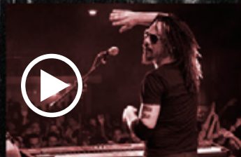
Videos en vivo